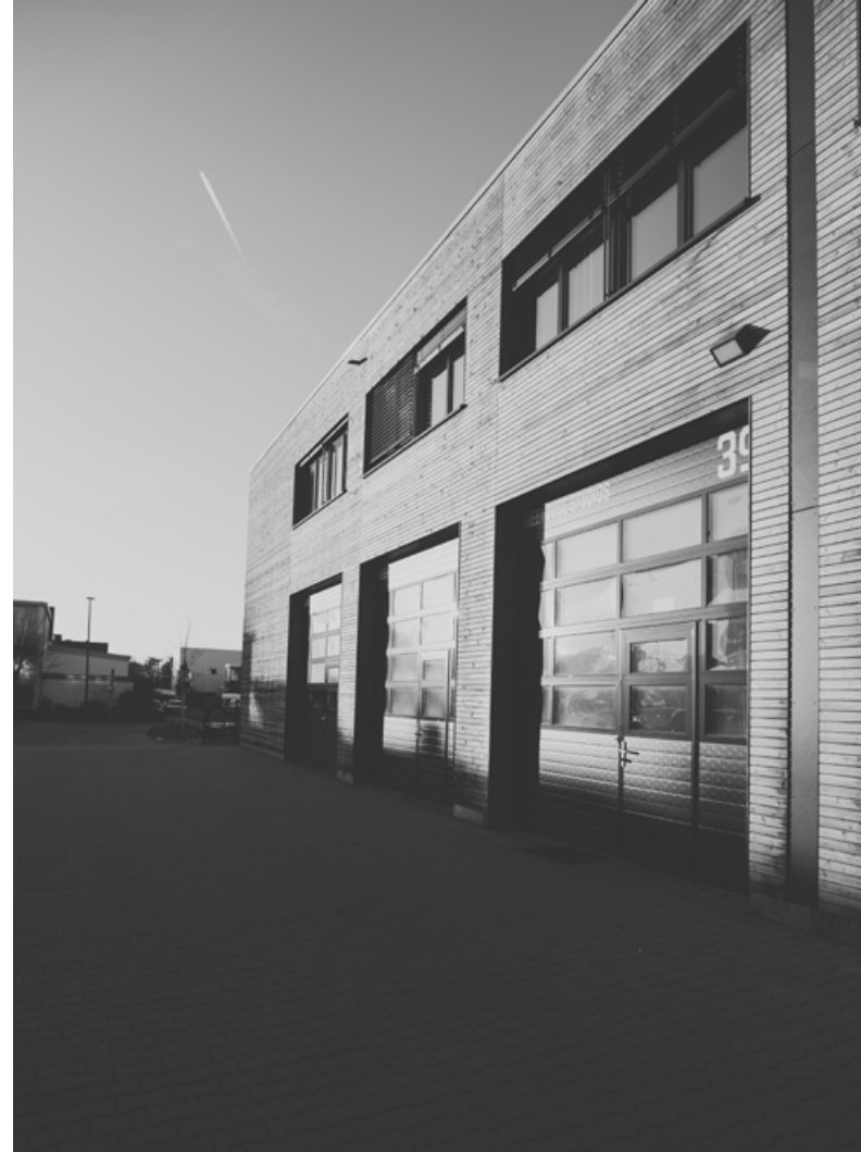
Cecil-Taylor-Ring 12-18, Tor 39-40, 68309 Mannheim